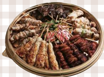
焼きとり五種盛合せ膳 500mm×500mm 8,797円(本体)