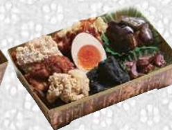
五宝唐揚げ重 ごほうからあげじゅう