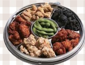
唐揚げ五種盛合せ膳 300mm×300mm 5,047円(本体)