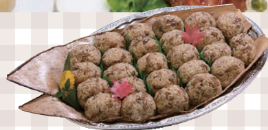
おにぎり オードブル 25玉 470mm×330mm 8,241円(本体)