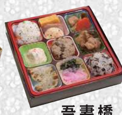
吾妻橋 あづまばし