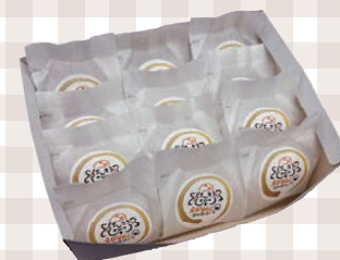
えびすめし12玉セット 275mm×220mm 5,315円(本体)