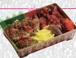
鬼弁 赤青 ハーフ&ハーフ