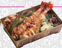
えび天重 えびてんじゅう