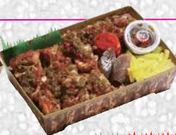
鬼弁 青 あおおに