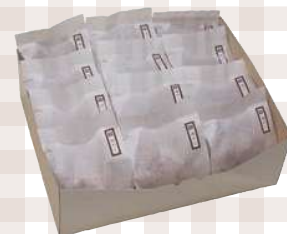
おにぎり 個包装12玉セット 275mm×220mm 4,213円(本体)