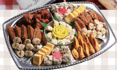
10名様~15名様 にぎわい膳 500mm×361mm 8,982円(本体)