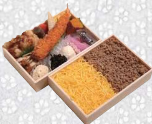
鶏そぼろ二段弁当