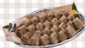
小町サイズおにぎり オードブル 25玉 470mm×330mm 5,084円(本体)