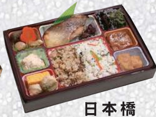
日本橋 にほんばし