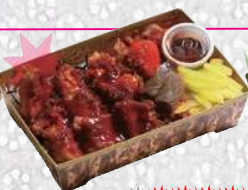
鬼弁 赤 あかおに