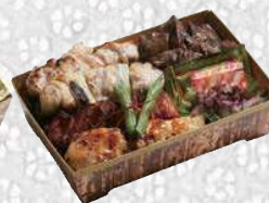
焼きとり重 やきとりじゅう