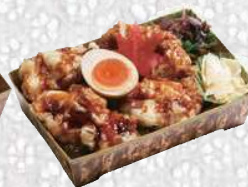
鶏天重 とりてんじゅう