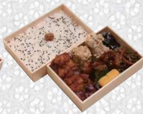
特製唐揚 二段弁当