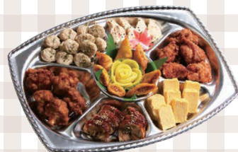
7名様~10名様 つどい膳 441mm×332mm 5,834円(本体)