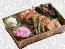
鶏照重 とりてりじゅう