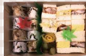
どっちもBOX おにぎり8玉 x サンド10切 275mm×220mm 3,982円(本体)