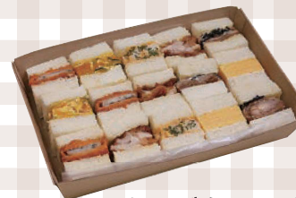
サンドウィッチ オードブル 15切 275mm×220mm 3,750円(本体)