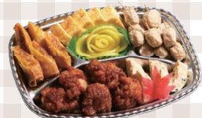
5名様~7名様 なごみ膳 279mm×189mm 3,982円(本体)